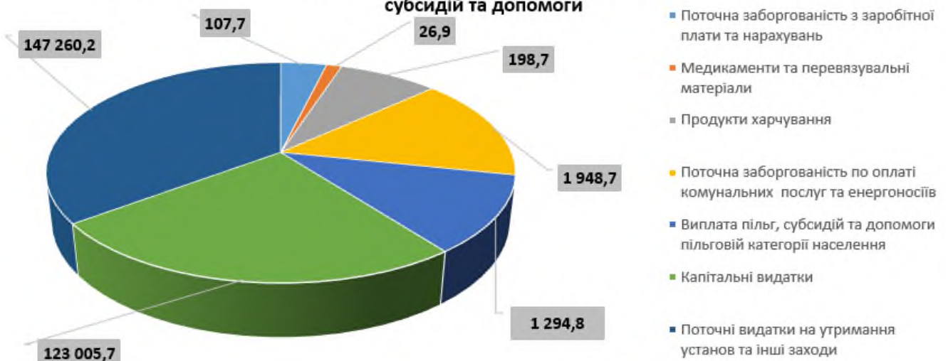
Структура кредиторської заборгованості за напрямками видатків з урахування пільг, субсидій та допомоги

Прострочена заборгованість становить 145 498,4 тис. грн. або 53,1 % до загального обсягу, з якої по Одеської МТГ – 44 606,7 тис. грн. або 16,3 % .