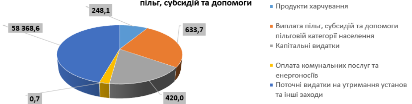
Структура кредиторської заборгованості за напрямками видатків з урахування пільг, субсидій та допомоги

Прострочена заборгованість становить 14 818,0 тис. грн. або 100,0 % до загального обсягу, з якої по Одеської МТГ – 0,0 тис. грн. або 0,0 % .