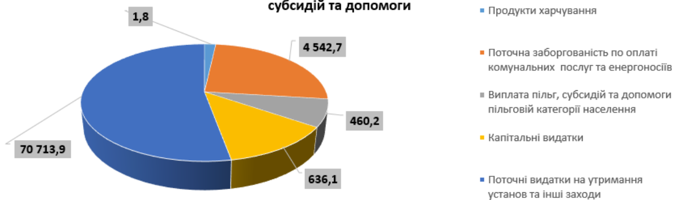
Структура кредиторської заборгованості за напрямками видатків з урахування пільг, субсидій та допомоги

Прострочена заборгованість становить 31 384,3 тис. грн. або 41,4% до загального обсягу, з якої по Одеської МТГ – 0,0 тис. грн. або 0,0 % .